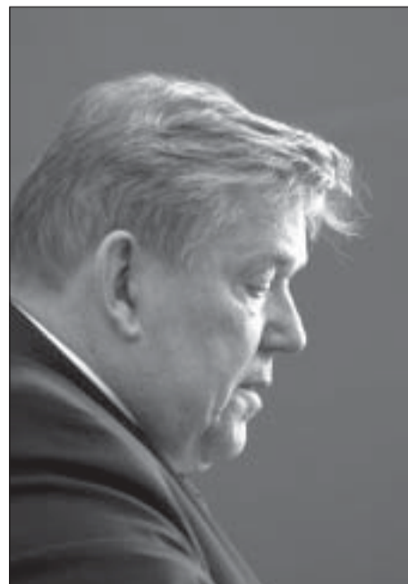
Islands socialminister Páll Petursson

Nej, jeg synes, det ville være en falliterklæring, at man skal skrive nogle pæne ord ned i en lov og tvinge dem igennem. Jeg foretrækker, at vi går den anden vej og løser de problemer, der diskriminerer. Det bør være menneskelige holdninger og politikformuleringer – som sektoransvarlighed og at man hele tiden arbejder med handicapområdet og har det på dagsordenen – der løser problemerne for de handicappede.