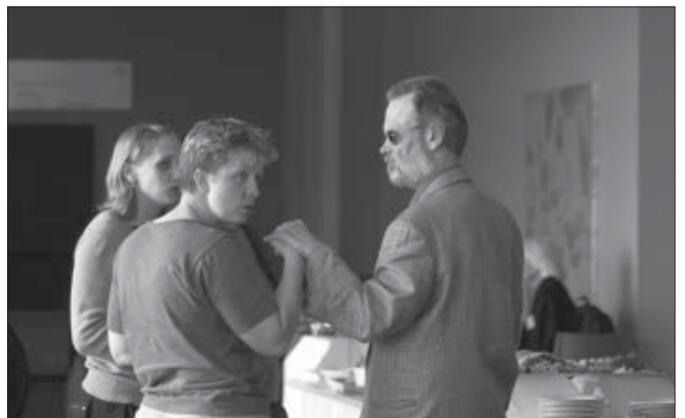
En tolk forklarer ved berøring af en døvblind, hvad der sker på konferencen.

Hvis det nordiske samarbejde bruges endnu mere bevidst fremover, kan det kvalificere diskussionen om strategier og værktøjer i det handicappolitiske arbejde og give mulighed for en fælles indflydelse i europæisk og internationalt samarbejde.