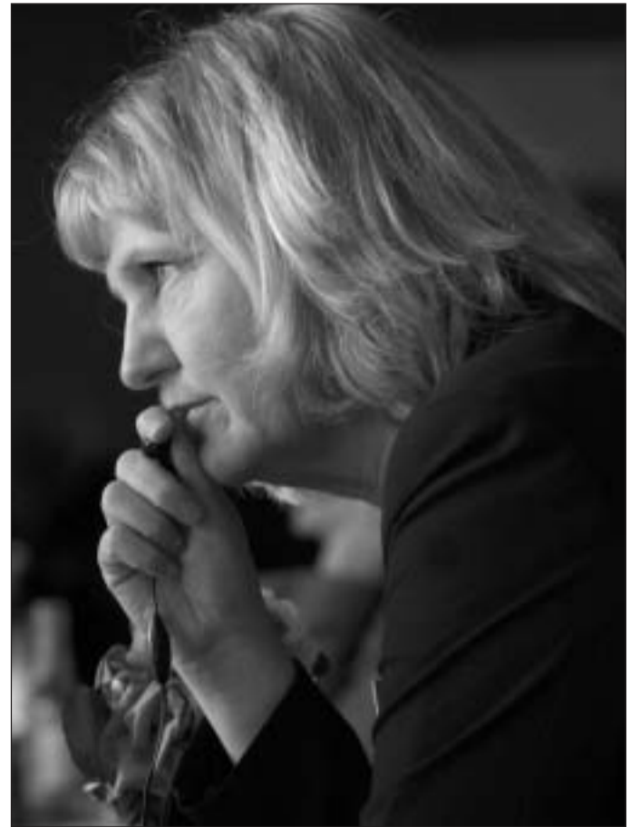
Sveriges barn- og familjeminister Berit Andnor

Det er en modbydelig tanke at kræve screening.