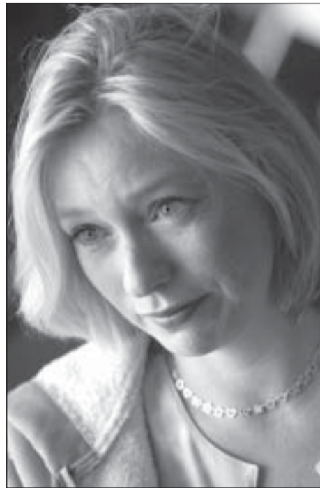
Danmarks socialminister Henriette Kjær

Der er selvfølgelig fokus på alle udgiftskrævende områder i perioder, hvor man strammer økonomien. Så ligesom alt andet skal dette område også tilpasses økonomisk.