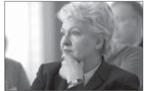
Finlands omsorgsminister Liisa Hyssälä

Vi har i cirka ti år haft meget høj arbejdsløshed og har ikke kunnet satse så meget på handicapområdet, som vi kunne ønske. Derfor er vi bagud sammenlignet med fx Sverige. Socialsektoren er meget ofte den første, som mærker det, når staten mangler penge. Men vores nye regeringsprogram skulle give gode muligheder, fx for at få flere handicappede i arbejde.