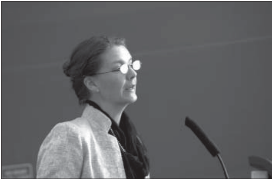
Norges sosialminister Ingjerd Schou

Det er ikke ofte, man har chancen for at mødes med fem ministre med ansvar for handicapområdet. Det måtte vi benytte os af ved at stille dem en række spørgsmål.